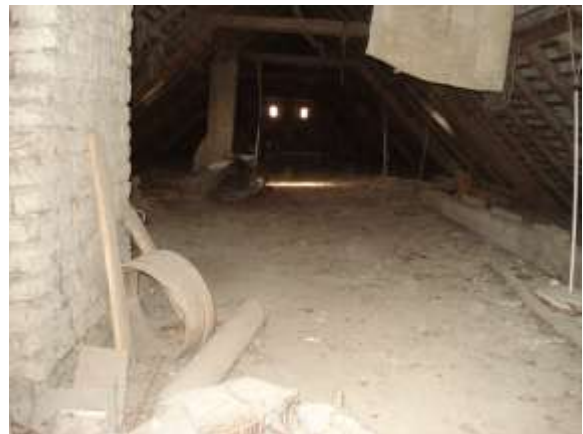
Padlástér átalakítás előtt